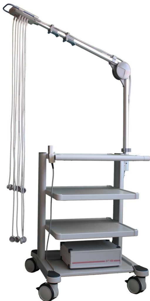
[Abbildung Gerätewagen mit Sonderausstattung]