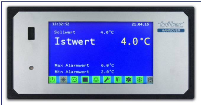
Benutzerfreundlich, intuitiv bedienbar