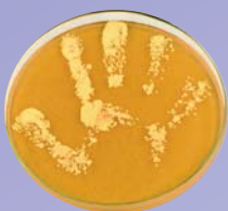
Handabklatsch ohne Seifenwaschung oder Desinfektion

Mit ihrer „Clean Care is Safer Care“-Initiative startete die WHO 2005 eine weltweite Kampagne für mehr Patientensicherheit. Im Mittelpunkt steht die Verbesserung der Händedesinfektion, da diese einen direkten Einfluss auf die Übertragung pathogener Erreger hat. Für dieses Ziel wurde das Konzept der „5 Momente der Händedesinfektion“ entwickelt (1).